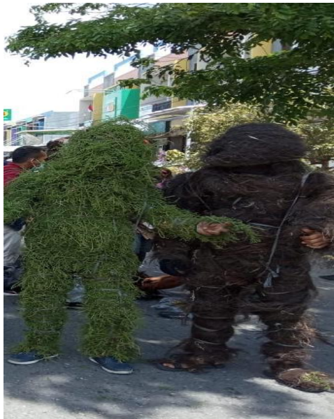
Pelaksanaan Tradisi 2019