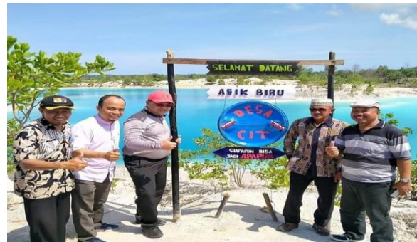
Gambar1. Kawasan Aek Biru (Desa Cit, Kabupaten Bangka, 2020)

KKN UBB pada tahu 2019. Dalam proses pengembangannya tentu tidak terlepas dari faktor yang mendukung guna menunjang agar pembangunannya dapat berkembang dan berjalan dengan optimal serta dapat menimbulkan manfaat terutama bagi masyarakat agar dapat mensejahterakan terutama dari segi perekonomiannya dengan adanya destinasi wisata di Desa Cit.