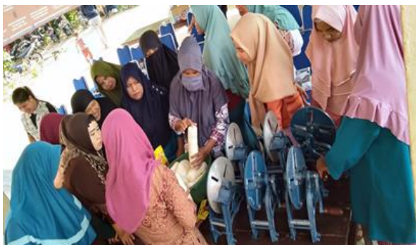
Gambar1. Kegiatan Pembuatan Keripik Singkong dan Sengkulak di Desa Tanjung Gunung, Kabupaten Bangka Tengah.

Potensi sumber daya alam yang ada di Desa Tanjung Gunung sendiri terdiri dari hasil laut dan hasil perkebunan. Dari potensi pertanian ini menghasilkan banyak jenis atau hasil yang diperoleh. Beragam jenis tumbuhan yang di tanam oleh petani di Desa Tanjung Gunung diantaranya adalah singkong. Tumbuhan singkong ini merupakan tumbuhan yang sudah lama di kenal oleh masyarkat luas. Singkong sudah banyak digunakan dalam berbagai macam panganan masyarakat. Singkong juga dapat di dimanfaatkan dalam berbagai bentuk olahan makanan bahkan bisa menjadi peluang usaha yang dapat menopang ekonomi masyarakat. Pangan lokal tersebut diantaranya adalah keripik ubi, sengkulak dan kemplang.