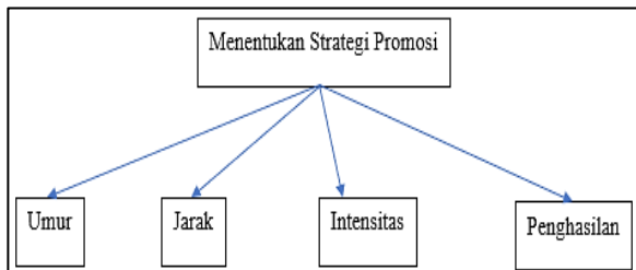
Gambar 2. Hierarki Proses

direkapitulasi menggunakan metode kuesioner, didapatkan variabel-variabel yang digunakan sebagai perhitungan yaitu umur, jarak, intensitas, dan penghasilan. Tahap pertama dalam AHP adalah membuat hirarki proses dari setiap variabel. Berikut adalah hirarki proses yang telah dibuat.