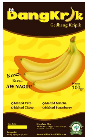
Gambar 7. Desain Label Baru Dangkrík