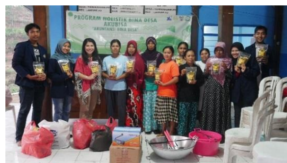
Gambar 8. Penyerahan Alat Produksi Kepada Mitra