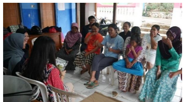
Gambar 8. Evaluasi dan Monitoring Bersama Mitra