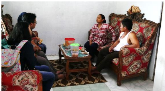
Gambar 2. Wawancara Dengan Mitra