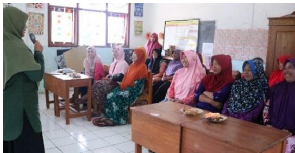
Gambar 3. Sosialisasi Home Industri Oleh Pemateri Kepada Mitra