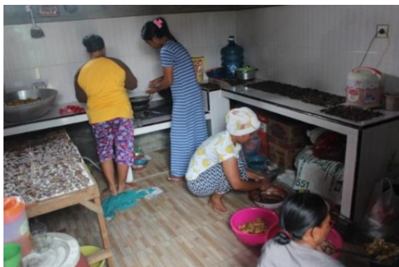
Gambar 4. Proses Produksi Dangkrík