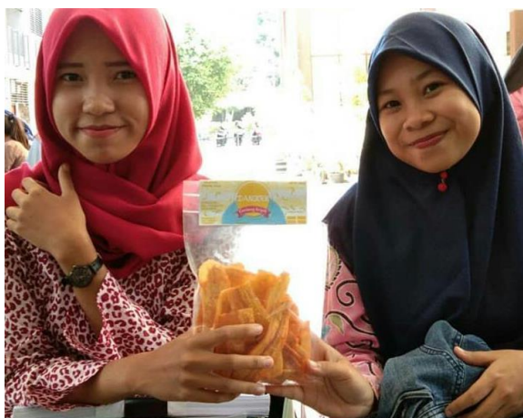
Gambar 5. Kemasan Lama Dangkrík