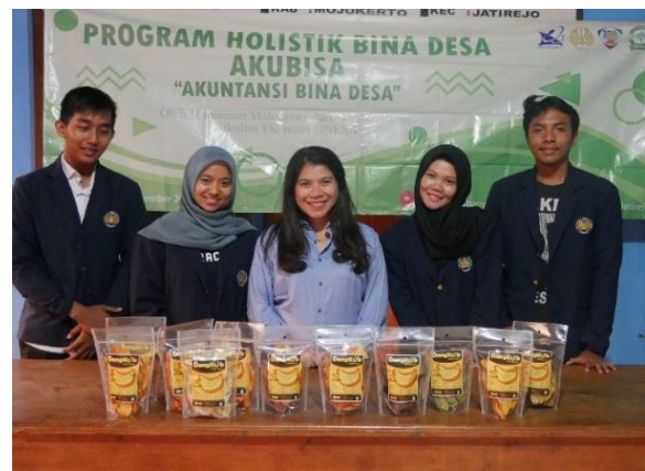
Gambar 6. Kemasan Baru Dangkrík